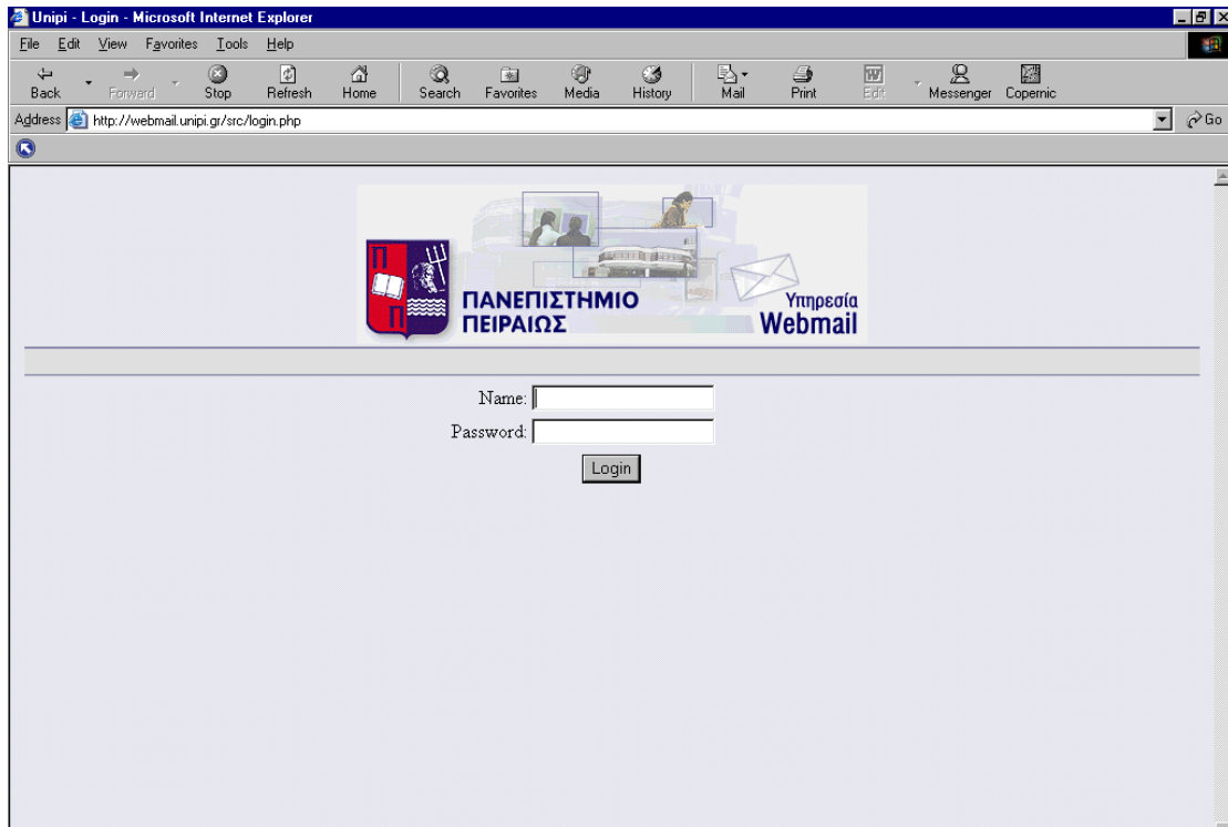
Εικόνα 2. Πρόσβαση στη υπηρεσία webmail

Στην σελίδα εισαγωγής στοιχείων πληκτρολογούμε τα εξής στοιχεία: